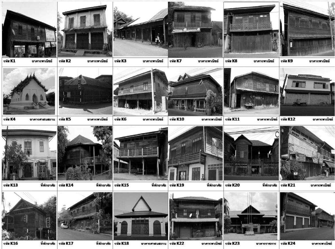
ภาพที่ 2 ชุมชนย่านการพาณิชย์ กลุ่มอาคารในถนนวิศิษฐ์ศรี ถนนเขมรรัฐการเชื่อมต่อกถนนกพะเนียง