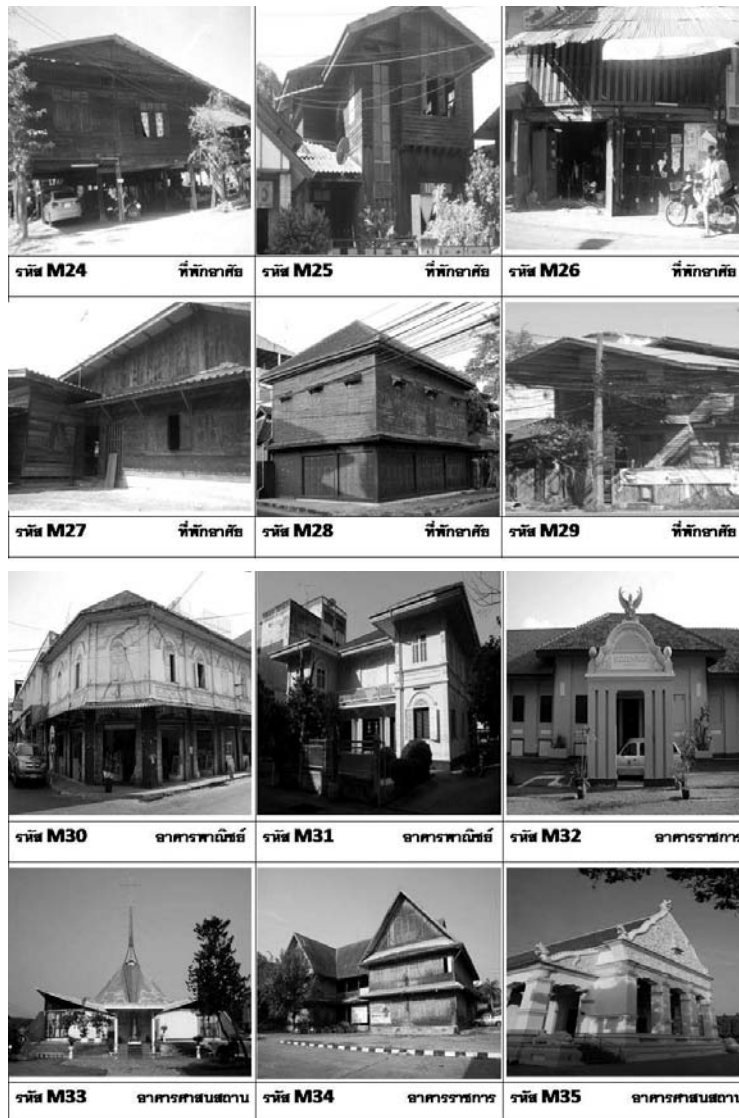
ภาพที่ 1 ชุมชนริมน้ำ กลุ่มอาคารชุมชนบุงกาแซว

1) ชุมชนริมน้ำ หมายถึง ย่านที่อยู่อาศัยที่ตั้งอยู่ริมน้ำโดยอาศัยการเข้าถึงทางน้ำในอดีต ซึ่ง ส่วนใหญ่มักมีองค์ประกอบอื่นๆ ด้วย เช่น ตลาด ร้านค้า ศาสนสถาน อาคารราชการ อาคารบ้านเรือนมักเป็นแบบห้องแถวไม้ ชุมชนลักษณะนี้พบมากในพื้นที่ริมฝั่งแม่น้ำ ซึ่งเป็นเส้นทางคมนาคมในอดีตเช่นชุมชนบุงกาแซวในเขตอำเภอเมือง