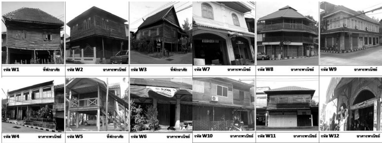
ภาพที่ 4 ชุมชนศูนย์กลางคมนาคมใหม่ กลุ่มอาคารในชุมชนถนนทหารเชื่อมต่อชุมชนรถไฟ

3) ชุมชนศูนย์กลางคมนาคมใหม่ หมายถึงชุมชนที่ประกอบไปด้วยที่อยู่อาศัยและตลาดที่ตั้งอยู่บนถนน มักอยู่ในพื้นที่ศูนย์กลางเมืองดั้งเดิมหรืออยู่ในพื้นที่เมืองเก่า เป็นชุมชนที่น่าจะมีต้นกำเนิดมาจากการเป็นศูนย์กลางหรือศูนย์รวมกิจกรรม (Node) การค้าที่อาศัยการเดินทางด้วยถนนและทางรถไฟเป็นหลัก แต่อยู่แบบกระจัดกระจาย ทั้งที่เป็นบ้านของเอกชน ศาสนสถาน อาคารพาณิชย์ แต่เมื่อมีการสร้างถนนและได้รับความนิยมมากขึ้นจึงปรับตัวให้เข้ากับเส้นทางคมนาคมแบบใหม่ ได้แก่ ชุมชนถนนทหารเชื่อมต่อชุมชนรถไฟ ในเขตอำเภอวารินชำราบ