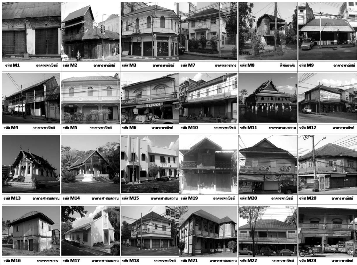
ภาพที่ 3 ชุมชนย่านการพาณิชย์ กลุ่มอาคารในชุมชนถนนหลวงอำเภอเมือง