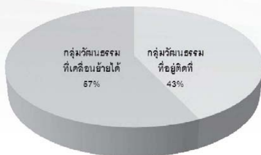
ภาพที่ 1 มรดกวัฒนธรรมที่จับต้องได้ในละครย้อนยุค