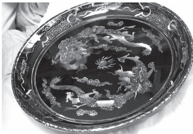
ภาพที่ 5 ถาดลาย aogai มุก

งาน Chinkin เริ่มที่จีนตั้งแต่สมัยราชวงศ์หยวนและราชวงศ์ซ่ง ริวกิวได้รับเทคนิคเข้ามาและได้ผลิตชิ้นงานประเภทนี้อย่างสมบูรณ์ในระหว่างศตวรรษที่ 15 ถึง 16 ลายที่นิยม ได้แก่ นกฟินิกซ์ เมฆนก กับดอกไม้และลายเครือเถา (Karakusa) มีลักษณะเฉพาะในการใช้ลายเรขาคณิตเป็นพื้นด้านหลังของภาพ งานประเภทนี้นอกจากจะทำขึ้นที่โอกินาวาแล้วยังผลิตที่อื่นๆ ของญี่ปุ่นด้วย เช่น ที่ Wajima เป็นต้น