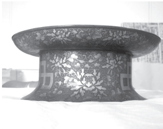
ภาพที่ 6 ถาด Tundabon ลายทองคำ

ในช่วงศตวรรษที่ 15 ถึง 16 มีความนิยมทำเครื่องมุกบนพื้นรักสีแดง เปลือกหอยที่ใช้มักจะหนาเล็กน้อย บางครั้งใช้ทั้งทองคำเปลว ผงทองและเส้นทองประดับรวมกับเปลือกหอย ต่อมาศตวรรษที่ 17 เป็นช่วงที่สำนักงานดูแลงานการขัดเปลือกหอย มีบทบาทสูงทั้งนี้เพื่อสร้างของกำนัลแก่โชกุนญี่ปุ่นเป็นหลัก ทำให้มีการสร้างเครื่องมุกหลายชิ้น และเป็นช่วงที่มีการพัฒนาเทคนิคถึงขั้นสูงสุด ลายมุกที่สร้างขึ้นมีความละเอียดอ่อนมาก บางครั้งมีการใช้วิธีโรยมุกด้วย ส่วนเครื่องบรรณาการที่ส่งไปจีนจะมีลวดลายมังกรซึ่งส่วนมากเป็นงานทาร์กสีคำเป็นหลัก อย่างไรก็ตามความต้องการสินค้าหุหราก็ได้ลดน้อยลงไปภายหลังการปฏิรูปเมจิ