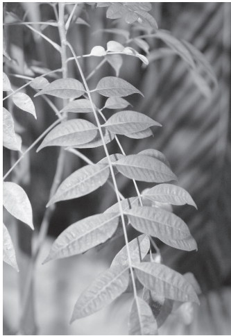
ภาพที่ 1 ใบต้นรักญี่ปุ่น

ก่อนอื่นผู้เขียนจะนำเสนอเรื่องคุณสมบัติของยางรักและเรื่องริวกิวอย่างคร่าวๆ ไว้ในบทนี้