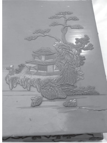
ภาพที่ 7 ภาพรักลายนูน Tsuikin

ที่โอกินาว่าภาพสีน้ำมันที่เรียกว่า Mitsudae ได้เริ่มต้นขึ้นปลายศตวรรษที่ 16 เป็นอย่างช้าและ ทำมาจนกระทั่งถึงศตวรรษที่ 18 ชิ้นงานในช่วงแรกมีทั้งภาพเขียนรัก ภาพเขียน Mitsudae และมีลายถมทองรวม กันหลังสงครามมหาเอเชียบูรพานิยมใช้วิธีดังกล่าวเขียนภาพของที่ระลึก โดยมีภาพดอกไม้ของโอกินาว่า