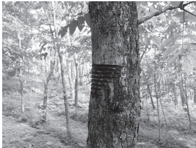
ภาพที่ 2 ต้นรักญี่ปุ่น

ยางรัก (urushi) เป็นวัสดุธรรมชาติที่ได้มาจากการกรีดเปลือกต้นรัก (ภาพที่ 1, 2) เพื่อให้ยางไหลออกมา เมื่อสกัดยางรักจากต้นรักได้แล้ว ยางรักจะแข็งตัวได้ดีด้วยการทำปฏิกิริยาของเอนไซม์ที่เรียกว่า แลคเคส (laccase) กับออกซิเจนจากไอน้ำในอากาศ สภาพแวดล้อมที่แลคเคสทำงานได้ดีจะต้องมีอุณหภูมิและความชื้นที่เหมาะสมในการแข็งตัวของยางรักคืออุณหภูมิ 20 ถึง 25 องศาเซลเซียสและความชื้นที่ 60 ถึง 75 เปอร์เซ็นต์ (ในกรณียางรักญี่ปุ่น) ถ้าอุณหภูมิและความชื้นไม่เหมาะสมแลคเคสจะทำงานไม่ได้ดี ยางรักก็จะแข็งตัวช้า ทำให้การสร้างงานรักไม่สามารถคืบหน้าไปได้ด้วยดี ยังมีปัญหาในการใช้ยางรักบางประการ เช่น หลายคนมักเกิดอาการแพ้ยางรัก ในประเทศไทยชาวบ้านมักตัดต้นรักที่อยู่ใกล้บ้านใกล้สวนทิ้งเรื่อยมา จนต้นรักกลายเป็นต้นไม้ที่หาได้ยาก ทุกวันนี้คนไทยไม่ค่อยรู้จัก “ต้นรัก” แล้ว แม้แต่คนญี่ปุ่นปัจจุบันบางคนก็ไม่ค่อยรู้จักเช่นกัน บางคนยังกลัวว่าถ้าใช้เครื่องรักจะทำให้เกิดอาการแพ้ยางรักได้ อันที่จริงถ้ายางรักแข็งตัวดีแล้วก็จะไม่ทำให้เกิดอาการแพ้