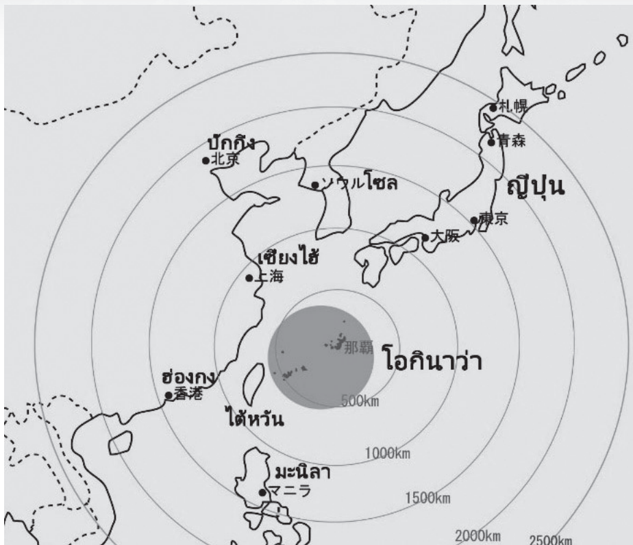
ภาพที่ 3 แผนที่โอกินาวา

โอกินาวา (ภาพที่ 3) เป็นจังหวัดหนึ่งของประเทศญี่ปุ่น ตั้งอยู่ทางทิศตะวันตกเฉียงใต้ของเกาะกิวชู ประกอบด้วยหมู่เกาะต่างๆ ประมาณ 160 เกาะ หมู่เกาะเหล่านี้เรียงกันอย่างต่อเนื่องจากทางทิศตะวันออกเฉียงเหนือไปทางทิศตะวันตกเฉียงใต้ จากเกาะที่ตั้งอยู่ทางทิศตะวันตกสุด สามารถมองเห็นเกาะไต้หวันได้ โอกินาวาจัดอยู่ในเขตกึ่งเขตร้อน อุณหภูมิเฉลี่ยทั้งปี 22.7 องศาเซลเซียส ซึ่งค่อนข้างร้อนเมื่อเทียบกับจังหวัดอื่นๆ ของญี่ปุ่น แต่ในช่วงฤดูร้อนมีอุณหภูมิเฉลี่ยไม่เกิน 30 องศา ส่วนปริมาณน้ำฝนเกิน 2,000 มม. ต่อปีซึ่งมากกว่ากรุงเทพฯ ความชื้นเฉลี่ยต่อปีสูงถึง 74 เปอร์เซ็นต์ กล่าวได้ว่ามีสภาพภูมิอากาศที่เหมาะสมสำหรับการทำเครื่องรักเป็นอย่างมาก