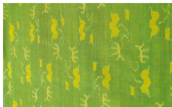
ตัวอย่างผ้าลายดอกสุพรรณนิการ์

Photo by Hussadin, Areewan. (February 27, 2015)