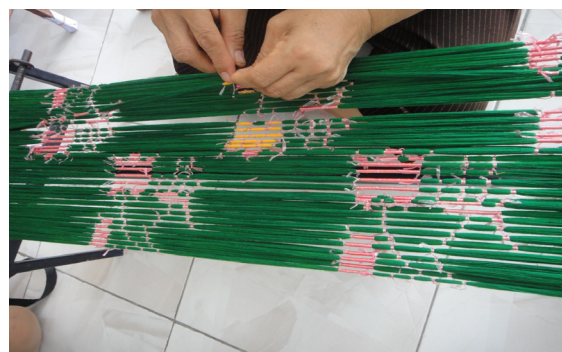
การโทมหมี่และการปลดหมี่

Photo by Hussadin, Areewan. (February 27, 2015)