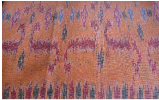
ตัวอย่างผ้าลายขอ

ขอ มาจากเรื่องเล่าของพญานาคที่ครั้งหนึ่งไม่สามารถบวชอยู่ได้ร่มศาสนาได้ จึงขอเป็นส่วนหนึ่งของศาสนา