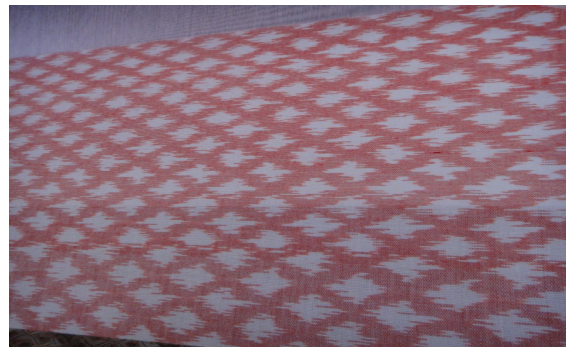
ตัวอย่างผ้าลายตุ้มตัน

Photo by Hussadin, Arewan. (February 27, 2015)