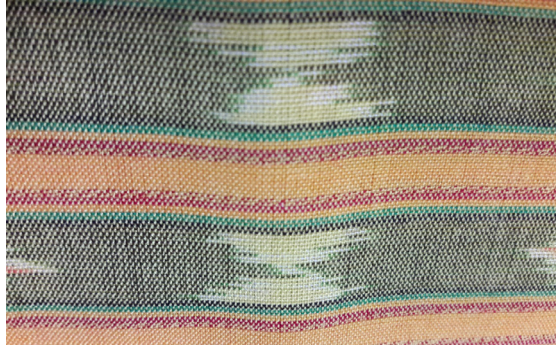
ตัวอย่างผ้าลายโพธิ์ศรี

โพธิ์ศรี เป็นส่วนหนึ่งของพิธีทอดกฐิน ในการทอดกฐินชาวพวนจะมีโพธิ์ศรี มีมัดหีบเงิน ซึ่งถือเป็นของศักดิ์สิทธิ์ในพิธีทางศาสนา