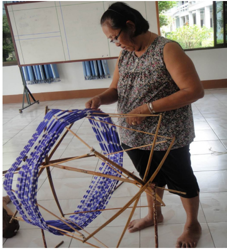
การนำไหมเข้ากรงและการคันไหม

Photo by Hussadin, Areewan. (February 27, 2015)