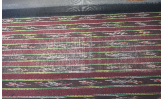
ตัวอย่างผ้าลายพญานาคน้อย

Photo by Hussadin, Arewan. (February 27, 2015)