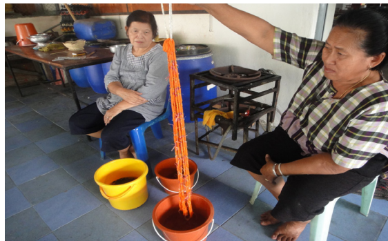
การย้อมหมี่