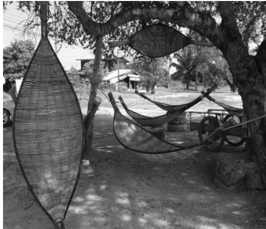
รูปที่ 7 ภูมิปัญญาการเรียนรู้การทำเปลยวน