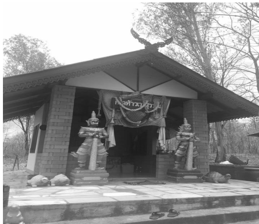
รูปที่ 6 ศาลท้าวเวสสุวรรณ ที่บ้านคลองเมืองนอก ตำบลโกสัมพี

5. ศักยภาพของอัตลักษณ์เมืองโบราณโกสัมพี มีการพบซากของเมืองโบราณอยู่รอบๆ บริเวณศาลรูปปั้นท้าวเวสสุวรรณ ซึ่งศาลนี้เป็นสถานที่เป็นสิ่งศักดิ์สิทธิ์ที่สำคัญของชุมชนโกสัมพี เมื่อชาวบ้านที่อยู่อาศัยในเขตเมืองโกสัมพีขับรถผ่านก็จะส่งสัญญาณบิปรถรถเปรียบเสมือนเป็นสิ่งศักดิ์สิทธิ์ประจำบ้านคู่มือเมืองของชุมชน ประชาชนที่ตำบลโกสัมพีมีทั้งชาวไทยพื้นถิ่นที่ราบและชาวไทยภูเขาเผ่าต่างๆ ประกอบด้วยเผ่าปากกัญญา หรือกระเหรี่ยง และเผ่าม้ง ซึ่งทำให้วัฒนธรรมที่เมืองโกสัมพี มีความแตกต่างในเรื่องของภาษา ประเพณีและวัฒนธรรม