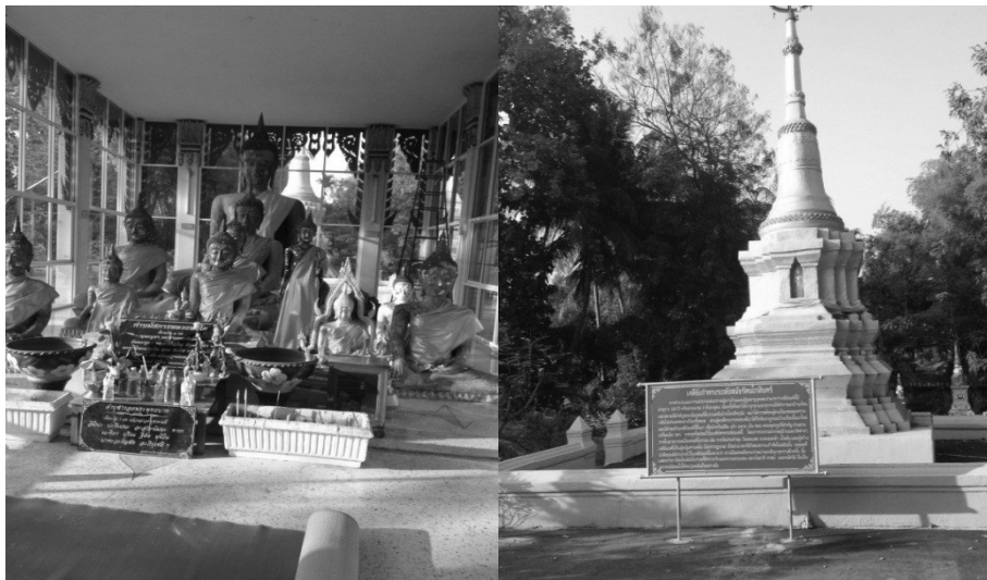
รูปที่ 5 หลวงพ่อโตวัดปราสาท

3. ศักยภาพของอัตลักษณ์เมืองโบราณคดีที่สำคัญ คือ วัดปราสาท ตั้งอยู่ในหมู่ 2 บ้านโคนใต้ เป็นวัดที่เป็นศูนย์กลาง ศูนย์รวมของชุมชนคนตีและแหล่งเก็บรวบรวมโบราณสถานและโบราณวัตถุที่สำคัญ ไว้เป็นพิพิธภัณฑ์ท้องถิ่นไว้ภายในวัด