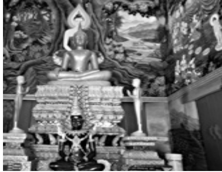
รูปที่ 4 ภายในวัดเทพนคร

3. ศักยภาพของอัตลักษณ์เมืองโบราณคดีที่สำคัญ คือ วัดปราสาท ตั้งอยู่ในหมู่ 2 บ้านโคนใต้ เป็นวัดที่เป็นศูนย์กลาง ศูนย์รวมของชุมชนคนตีและแหล่งเก็บรวบรวมโบราณสถานและโบราณวัตถุที่สำคัญ ไว้เป็นพิพิธภัณฑ์ท้องถิ่นไว้ภายในวัด