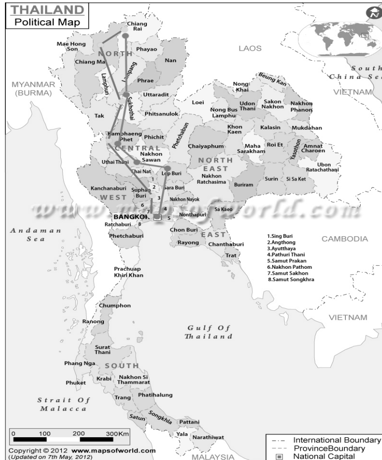
รูปที่ 1 เส้นทางที่นักท่องเที่ยวนิยมเดินทางมาเที่ยวในประเทศไทยจากภาคกลางไปภาคเหนือ ที่มา : Somnuxpong, S. (2007)

ซึ่งจากเส้นทางที่นักท่องเที่ยวจะเดินทางมาเที่ยวจะสังเกตว่าได้ผ่านมาที่จังหวัดกำแพงเพชร แต่นักท่องเที่ยวจะไม่ได้ค้างคืนเพียงแค่นั่งผ่านไปจังหวัดทางสุโขทัยและขึ้นไปทางภาคเหนือเชียงใหม่และเชียงราย ซึ่งจังหวัดกำแพงเพชรเป็นจังหวัดที่อยู่ภาคเหนือตอนล่างเป็นเมืองโบราณที่มีความสำคัญตั้งแต่สมัยสุโขทัยมีอายุมากกว่า 700 ปี มีอุทยานประวัติศาสตร์กำแพงเพชรเป็นหนึ่งในมรดกโลกทางวัฒนธรรมของประเทศไทย (Cultural World Heritage) จากองค์กร UNESCO ร่วมกับอุทยานประวัติศาสตร์สุโขทัยและอุทยานประวัติศาสตร์ศรีสัชนาลัย ซึ่งจังหวัดกำแพงเพชรมีจำนวนนักท่องเที่ยวที่เข้ามาเที่ยวภายในค่อนข้างน้อยมาก อาจจะด้วยความสำคัญทางประวัติศาสตร์ที่ไม่ได้เป็นเมืองหลัก แต่มีสถานะเป็นเมืองหน้าด่านมีหน้าที่เป็นเมืองหน้าลูกหลวงคอยปกป้องเมืองหลวง