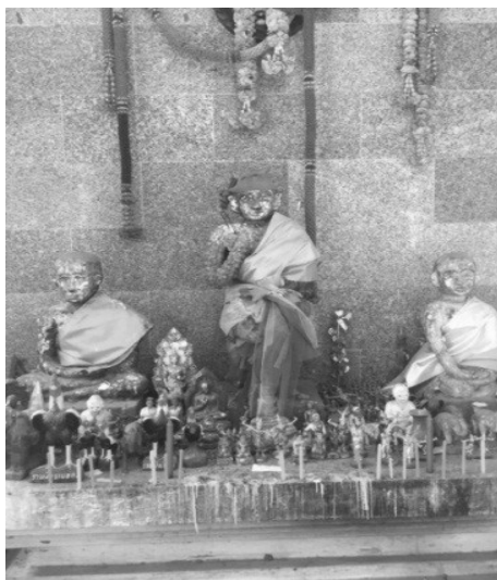
รูปที่ 3 ศาลท้าวแสนปมและรูปปั้นท้าวแสนปม

1. ศักยภาพของอัตลักษณ์เมืองโบราณไตรตรึงษ์ที่สำคัญ คือ วัดวังพระธาตุ ซึ่งเป็นสถานปฏิบัติธรรมและเรียนรู้ด้านสถาปัตยกรรมในสมัยสุโขทัยบริเวณวัดวังพระธาตุ มีโบราณสถานที่สำคัญ ได้แก่ พระอุโบสถ เจดีย์และวิหาร มีมาตั้งแต่สร้างวัดและค่อนข้างมีความสมบูรณ์ ซึ่งถือว่าเป็นเจดีย์ทรงพุ่มข้าวบิณฑ์หรือเจดีย์ทรงดอกบัวตูม ที่เป็นศิลปะสมัยสุโขทัย วิหารเก่าโบราณ เหลือแต่ฐานของวิหาร เป็นอิฐมีเสาเป็นศิลาแลง และด้านหน้าเป็นองค์หลวงพ่อดำซึ่งเดิมมีแต่เศียร ปูนปั้นมีลักษณะหน้ายิ้ม หูยาน แต่ปัจจุบันได้มีการหล่อเป็นพระพุทธรูปปูนปั้นสีขาวเต็มองค์ และนำขึ้นไปประดิษฐานบนวิหารเก่าโบราณ โบสถ์ซึ่งภายในมีพระพุทธรูปศักดิ์สิทธิ์ และมีศาลท้าวแสนปมบริเวณตรงข้ามวัดวังพระธาตุ ซึ่งเรื่องท้าวแสนปมเป็นตำนานที่มีชื่อเสียงเป็นเรื่องตำนานที่เล่าต่อมาเป็นเวลานาน (Arnamwat, T., 1985 & Sornchu, R., 2015) ซึ่งปัจจุบันมีรูปปั้นจำลองท้าวแสนปมอยู่ 2 บริเวณ บริเวณแรกภายในวัดวังพระธาตุ และอีกบริเวณเป็นศาลที่สร้างขึ้นตรงข้ามวัดวังพระธาตุ