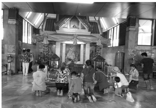
ภาพที่ 3 ประชาชนสักการะเจ้าพ่อพญาแล

ผู้วิจัยตระหนักและให้ความสำคัญต่อการสืบสานประเพณีควบคู่กับการจัดการท่องเที่ยวให้มีศักยภาพสูงสุดซึ่งสอดคล้องกับ Matura Suansri (2016) ที่ศึกษาเรื่องแนวทางการพัฒนาและส่งเสริมการท่องเที่ยวเพื่อสะท้อนอัตลักษณ์ ตลาดน้ำบางน้ำผึ้ง จังหวัดสมุทรปราการ กล่าวคือนักท่องเที่ยวมีความพึงพอใจต่อชุมชนด้านจัดการสถานที่ที่เป็นแหล่งท่องเที่ยวซึ่งดำรงไว้ซึ่งเอกลักษณ์และวัฒนธรรมท้องถิ่น ด้านสิ่งอำนวยความสะดวกความสะดวกในการเดินทาง ด้านการให้บริการร้านค้าและสินค้ามีการให้บริการที่ดีสุภาพอ่อนน้อมมีอัธยาศัยดีและด้านบุคลากรให้บริการนักท่องเที่ยวด้วยความเต็มใจใส่ใจนักท่องเที่ยว สำหรับแนวทางในการพัฒนาและส่งเสริมการท่องเที่ยวเพื่อสะท้อนอัตลักษณ์ของชุมชนคือการบริหารจัดการการท่องเที่ยวโดยการมีส่วนร่วมกับชุมชนในการกำหนดอัตลักษณ์ของชุมชนที่มีส่วนส่งเสริมการท่องเที่ยวอย่างยั่งยืน สอดคล้องกับ Paweena Ngamprapasom (2018) ได้ศึกษาเรื่องการอนุรักษ์และสืบสานความหลากหลายทางชีวภาพของภูมิปัญญาท้องถิ่นด้านอาหารพื้นเมืองภายใต้การมีส่วนร่วมของกลุ่มชาติพันธุ์อิมปี ตำบลสวนเขื่อน อำเภอเมือง จังหวัดแพร่ กล่าวคือกลุ่มแกนนำของชุมชนควรเข้ามามีบทบาทหลักในการจัดกิจกรรมที่สืบสานอัตลักษณ์ของชุมชนอย่างต่อเนื่องเพื่อให้เกิดความยั่งยืน