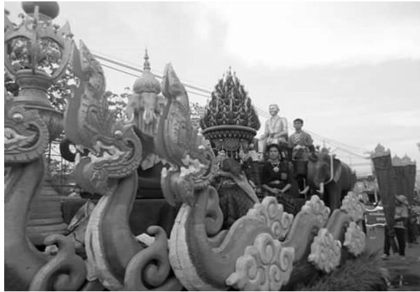
ภาพที่ 1 ขบวนแห่ในงานประเพณีบุญเดือนหก

2) ปัจจัยด้านภาวะผู้นำมีการติดต่อประสานงานและให้ความร่วมมือกับหน่วยงานภาครัฐและเอกชน โดยผู้ว่าราชการจังหวัดได้กำหนดวางแผนงานมีการจัดประชุมมอบหมายหน้าที่มีการแต่งตั้งคณะกรรมการในท้องถิ่นได้มีส่วนร่วมจัดการในประเพณีบุญเดือนหกพร้อมกัน สะท้อนให้เห็นถึงความเข้มแข็งของผู้นำและวิสัยทัศน์ในการกระจายอำนาจสู่ชุมชนให้มีส่วนร่วมพัฒนาและภาคภูมิใจร่วมกัน