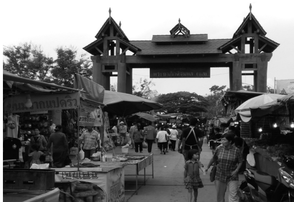
ภาพที่ 2 บรรยากาศการออกร้านค้าในงาน

2. ปัจจัยด้านภาวะผู้นำประเพณีบุญเดือนหกถือเป็นประเพณีที่ยิ่งใหญ่โดยในทุกปีท่านผู้ว่าราชการจังหวัดชัยภูมิจะเป็นประธานเปิดงานพร้อมนำชาวชัยภูมิทำพิธีถวายสักการะบวงสรวงขอพรต่อดวงวิญญาณอันศักดิ์สิทธิ์ของพระยาภักดีชุมพล หรือเจ้าพ่อพญาแลเจ้าเมืองชัยภูมิคนแรก มีการติดต่อประสานงานและให้ความร่วมมือแก่หน่วยงานภาครัฐและเอกชน โดยผู้ว่าราชการจังหวัดได้กำหนดวางแผนงานมีการจัดประชุมมอบหมายหน้าที่มีการแต่งตั้งคณะกรรมการในท้องถิ่นให้มีส่วนร่วมจัดการในประเพณีบุญเดือนหกด้วยกัน สะท้อนให้เห็นถึงความเข้มแข็งของผู้นำและวิสัยทัศน์ในการกระจายอำนาจสู่ชุมชนได้มีส่วนร่วมพัฒนาและเกิดความภาคภูมิใจที่ได้ทำงานร่วมกัน