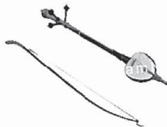
เครื่องดนตรีพื้นเมืองล้านนา “สล้อ”