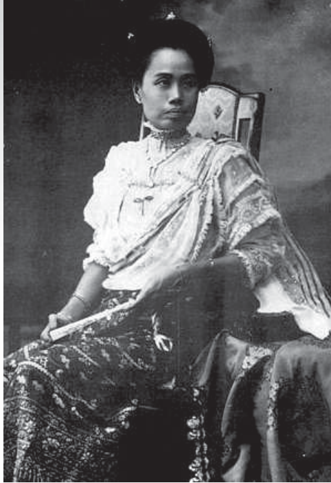
พระราชชายาเจ้าดารารัศมี