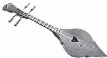
เครื่องดนตรีพื้นเมืองล้านนา “ซิง”

วัฒนธรรมที่สำคัญของชาวล้านนา ได้แก่ ภาษา ศิลปะ อาหาร การแต่งกาย สถาปัตยกรรม และดนตรี โดยเฉพาะวัฒนธรรมทางด้านดนตรีของชาวล้านนา เป็นวัฒนธรรมที่มีความเจริญรุ่งเรือง มีวิวัฒนาการของเครื่องดนตรี และมีบทเพลงไพเราะ ลีลาอันแสดงให้เห็นถึงภูมิปัญญาอันล้ำเลิศของประชาชนในดินแดนแห่งนี้