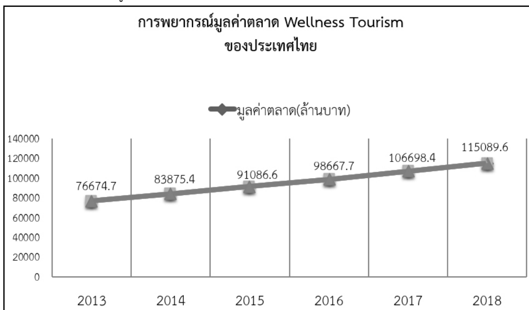
ภาพที่ 5 : การพยากรณ์มูลค่าตลาด Wellness Tourism ของประเทศไทย