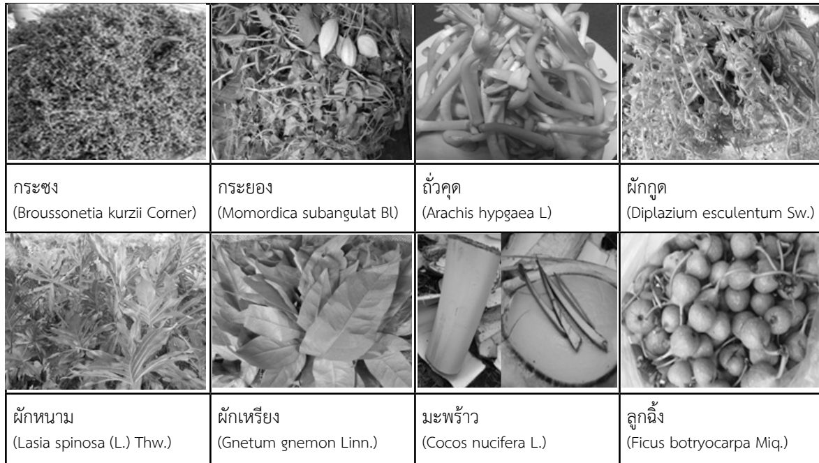
ภาพที่ 1 ผักพื้นบ้านเด่นของชุมชน

ผักพื้นบ้านที่นำมารับประทานเป็นอาหาร มีทั้งประเภทไม้ต้น ไม้ล้มลุกในสัดส่วนใกล้เคียงกัน โดยมีส่วนของผักพื้นบ้านที่นิยมนำมาประกอบอาหารมากที่สุด คือ ยอดอ่อน ใบ ร้อยละ 48.09 (63 ชนิด) ลูก ผัก ร้อยละ 37.40 (49 ชนิด) ลำต้น ร้อยละ 16.79 (22 ชนิด) ดอก ร้อยละ 15.26 (20 ชนิด) หัว/ราก ร้อยละ 11.45 (15 ชนิด) และเมล็ด ร้อยละ 4.58 (6 ชนิด) โดยมีผักพื้นบ้านเด่นของชุมชน เช่น กระชง (สะแล) กระยง (ผักมะะ) ถั่วคุด (ถั่วลิสง) ผักกูด ผักหนาม ผักเหริยง มะพร้าว และลูกฉิ่ง (มะเตื่อ) ดังภาพที่ 1